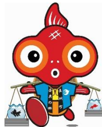
長洲町マスコットキャラクター 「ふれきんちゃん」