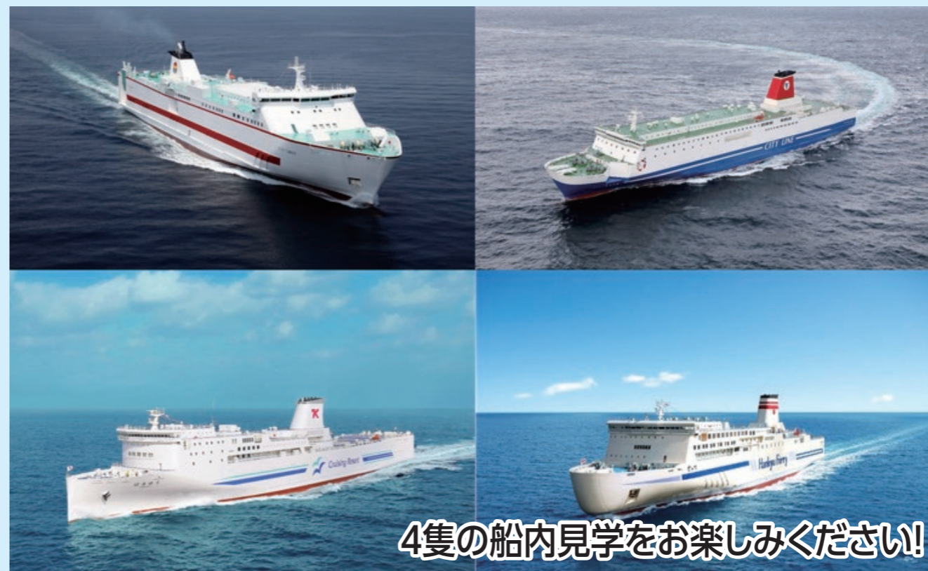
4隻の船内見学をお楽しみください!