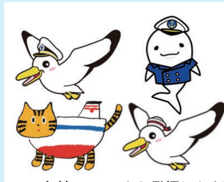
各社マスコットも登場します!