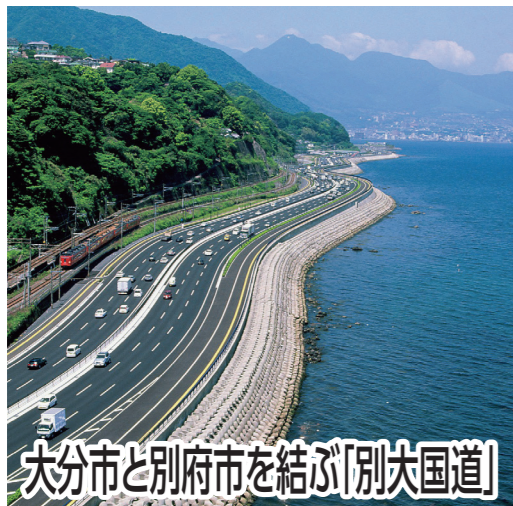
大分市と別府市を結ぶ「別大国道」