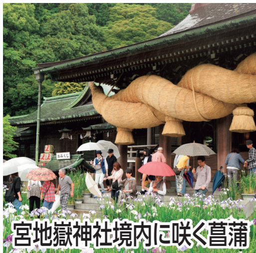
宮地嶽神社境内に咲く菖蒲