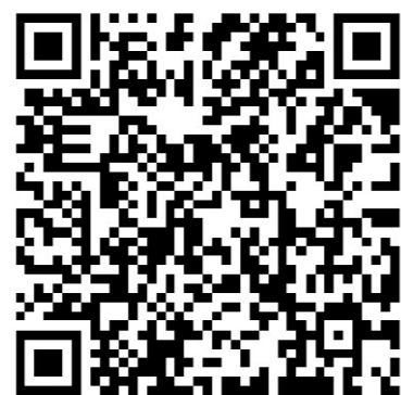
皿倉山健康ウォーク ホームページ

幅広い世代の方に楽しんでいただけます。事前申込と参加費1名500円(小学生以下無料)が必要です。スタート・ゴールは東田大通り公園です。