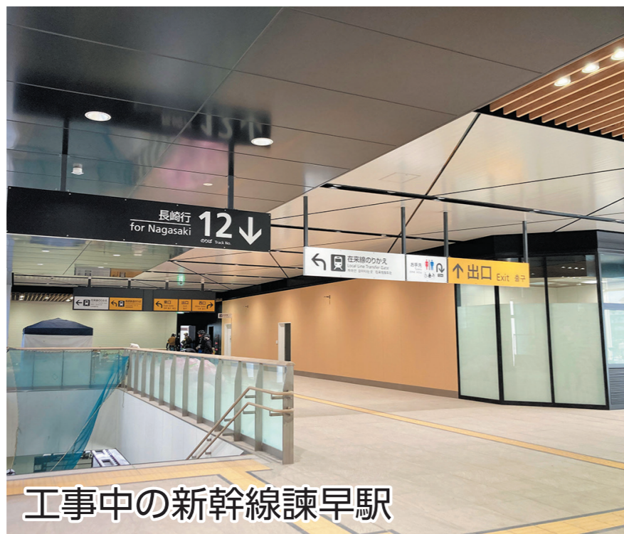
工事中の新幹線諫早駅