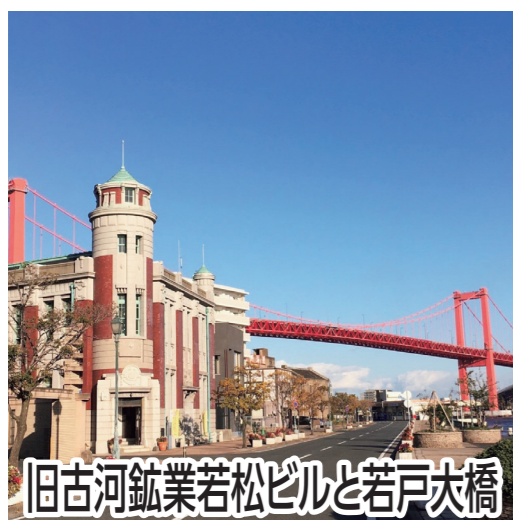
旧古河鉱業若松ビルと若戸大橋