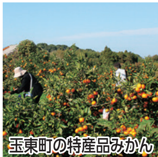
玉東町の特産品みかん