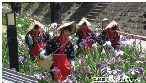
高瀬裏川 花しょうぶまつり

日本マラソンの父、ゆかりの地めぐりと花しょうぶが咲き誇る高瀬裏川水際緑地公園、五重塔がある蓮華院誕生寺本院など、自然と歴史を満喫できるみどころ満載のコースです。