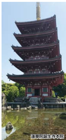
蓮華院誕生寺本院