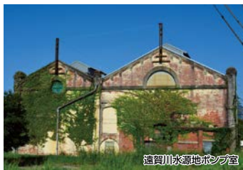
遠賀川水源地ポンプ室

平成27年に世界遺産に登録された「遠賀川水源地ポンプ室」、遠賀川にかかるたくさんの「鯉のぼり」、境内築山の花々が見事な「月瀬八幡宮」など中間市の美しい風景をご堪能ください。