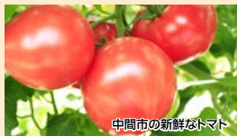
中間市の新鮮なトマト