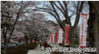
ブリヂストン通りのさくら並木

さくらまつり音楽祭 篠山城跡で開催される「さくらまつり音楽祭」。特設ステージにて和太鼓や吹奏楽等の演奏を楽しめます。