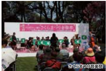
さくらまつり音楽祭

久留米の歴史、文化を感じながら、「さくらまつり音楽祭」を楽しんでいただくゆったりとしたコースです。