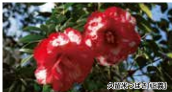
久留米つばき(正義)