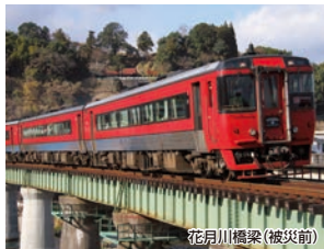
花月川橋梁(被災前)

昨年7月に九州北部豪雨で甚大な被害を受けた花月川橋梁。皆さまからのご支援を賜り、ついに復旧を果たすことができました。今回は久大本線全線復旧を祝い、不通となっていた光岡駅～日田駅を巡る特別コースです。