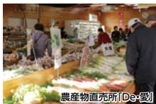
農産物直売所「De・愛」