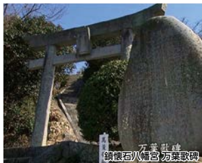
石葺歌碑 鎮懐石八幡宮 万葉歌碑

旧街道の歴史ある神社、仏閣や街並みをテーマに由緒ある地を巡るコースです。当日は福吉漁港にて産業まつりが開催され、秋の恵みが大集し、地元小学生が栽培した新米のつかみ取りなどイベントも盛りだくさんです。