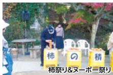
柿祭り&amp;ヌーボー祭り