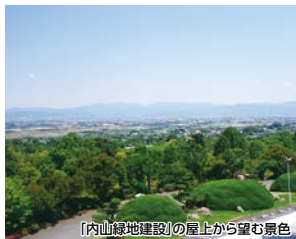
「内山緑地建設」の屋上から望む景色

田主丸の秋の特産市である「耳納の市」と、旬な柿と巨峰ワインが味わえる「柿祭り&ヌーボー祭り」が同日開催され、参加できるコースです。是非、この機会に晩秋の田主丸を満喫してください。