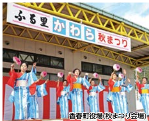
香春町役場(秋まつり会場)

秋の色に染まった山々と、名所を巡るウォーキングコースです。さらに、ゴールの香春駅手前では秋の実りを祝う「ふるさと香春秋まつり」が開催され、たくさんの出店や催しが行われますのでぜひ、お立ち寄りください。