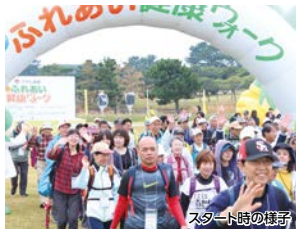
スタート時の様子

さわやかな晴天のもと、気楽にできる「ウォーキング」を通じて「心と体」の「健康づくり」の大切さを感じてください。参加料は一人200円で事前の申込みが必要です。