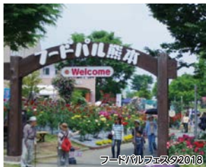
フードパルフェスタ2018

約800年を生きる大クス「寂心さんの樟(くす)」を巡り、サイクリングロードを歩いて、荒神様を祀る「西浦荒神社」へ向かいます。最後に「フードパルフェスタ2018」で地元の特産や「熊本ワイン」をご堪能ください。