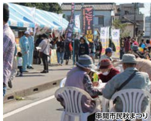
串間市民秋まつり

美味しい地場産品が並び、ふるまい多数の串間市民秋まつりのメイン会場や、国の重要文化財に指定されている旧吉松家住宅での催しもお楽しみください。コース中、川沿いのウォーキングも爽快ですよ!