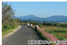
コスモスウォーキング