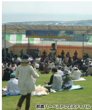
都農ハーベストフェスティバル

都農町の街並みを歩くと、神武天皇が東征の際に立ち寄って祈願したと言われる日向国一の宮都農神社があります。歩みを進めると滝の多い尾鈴山を眺められる都農ワイナリーに到着です。都農ハーベストフェスティバルをお楽しみください。