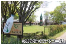
永利牧場(ロングコース)

キリンビール福岡工場コスモス園 約7ヘクタールの敷地に赤、ピンクなど1,000万本のコスモスが咲き乱れます。