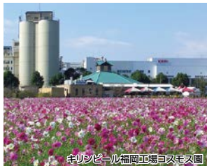
キリンビール福岡工場コスモス園

花立山温泉では美肌の湯をお楽しみいただき、戦跡の掩体壕、貴重な戦時資料がある大刀洗平和記念館を巡るコースです。最後はキリンビール福岡工場で素晴らしい景観のコスモスとビールをご堪能ください。