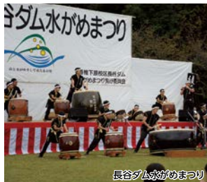
長谷ダム水がめまつり

1,800年の歴史がありパワースポットとしても注目を浴びる香椎宮にて旅の安全を祈願し、福岡市の水源である長谷ダムを目指します。長谷ダム記念公園広場では、「長谷ダム水がめまつり」が開催されます。