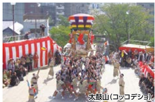
太鼓山(コッコデシヨ)

長崎くんちは国の重要無形民俗文化財に指定されている祭りであり、7つの踊町が市内の中心部をねり歩きます。当日は※1「長崎くんちナビ」を利用し各踊町のおおよその位置を把握してお楽しみいただけます。