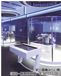
安川電機みらい館