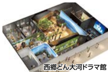
西郷どん大河ドラマ館