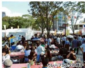
カレーフェスタの様子

九州最大級のカレーフェスタで、県内外から話題のカレーが堪能できるウォーキングです。また、西郷どんのゆかりの地を巡り、大河ドラマ館やリニューアルした維新ふるさと館をお楽しみください。