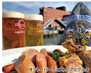
オクトーバーフェストビアとグルメ

関門橋を臨む海岸線を歩いた後は、5つの商店街を通り、懐かしい雰囲気を感じながら新鮮な魚介類、青果等をお楽しみいただけます。また、九州オクトーバーフェスト会場ではオリジナルの地ビールを堪能できます。