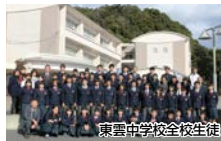
東雲中学校全校生徒