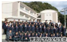
東雲中学校全校生徒