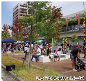
いとにぎわい祭り(イメージ)

福岡西区の長垂海岸の海風を浴び、縁結びで有名な出雲大社の分院を通ります。いとにぎわい祭りでは大人も子どもも楽しめること間違いなし!どなたでも楽しめるコースとなっています。