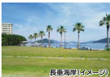
長垂海岸(イメージ)