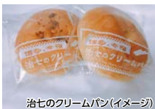
治七のクリームパン(イメージ)