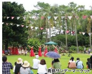
青島サンデーマーケット

南国情緒あふれるビーチ沿いを心地よい潮風を浴びながらウォーキング。縁結びの神様が祀られる青島神社や温泉、カフェなど青島の魅力が詰まったコースです。当日は、青島サンデーマーケットも開催!!