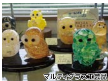
マルチグラス工芸品