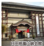
日田祇園山鉾会館