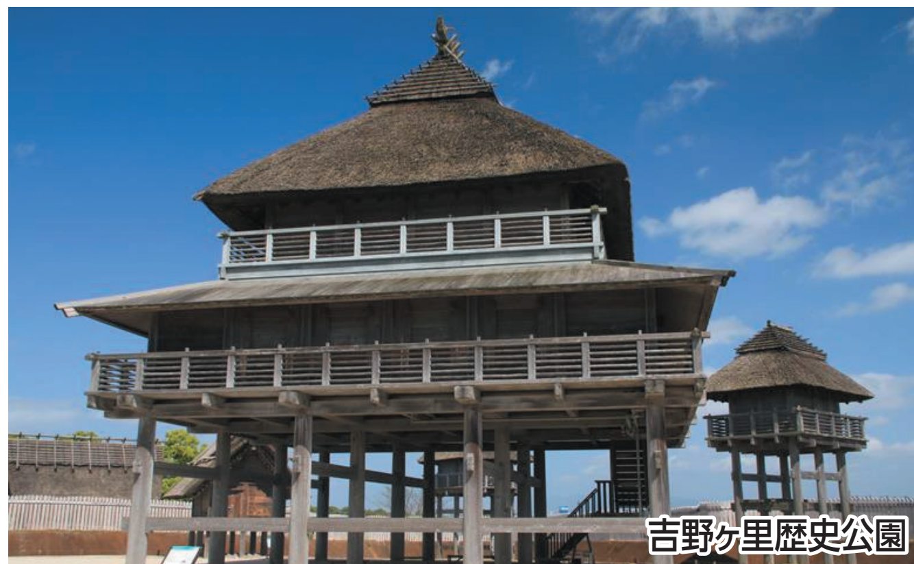
吉野ヶ里歴史公園