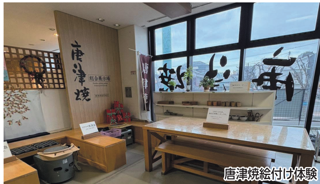
唐津焼絵付け体験