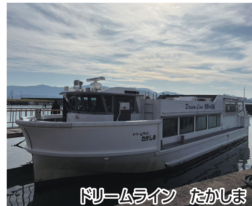
ドリームライン たかしま