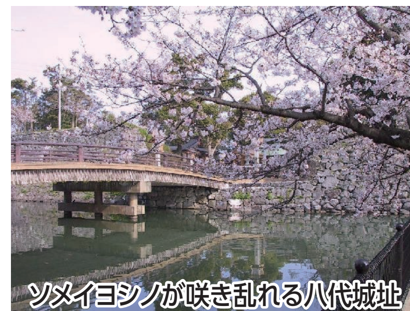
ソメイヨシノが咲き乱れる八代城址