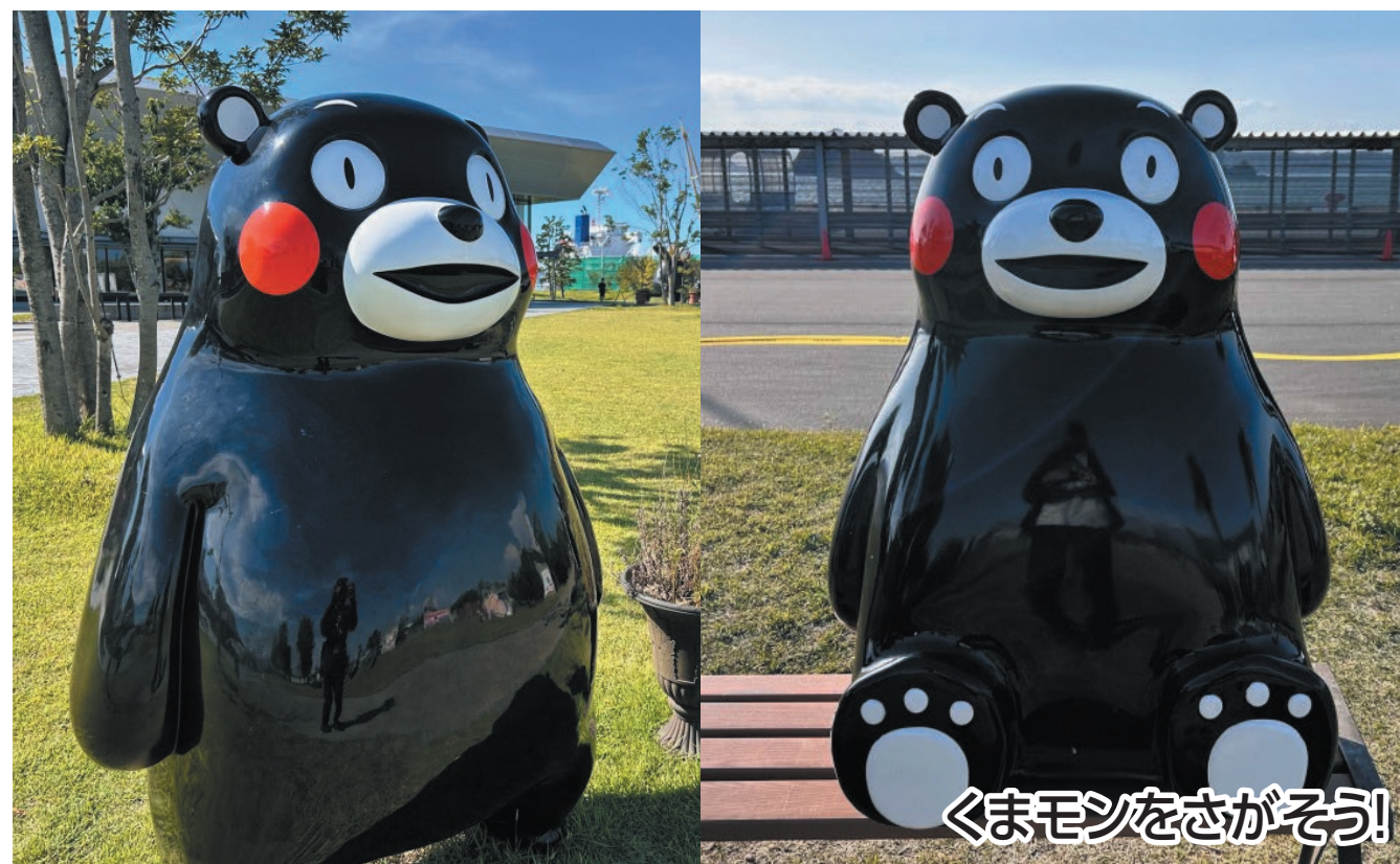
くまモンをさがそう!

新八代駅から八代の中心地をめぐり、桜咲く八代城や本町アーケード街、河川敷など家族で楽しめるコースです。まちなかにはくまモンがいっぱいいるよ!くまモンをさがして一緒に写真をとって、謎解きを楽しもう!