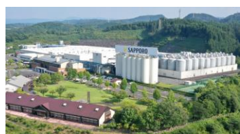
サッポロビール 九州日田工場