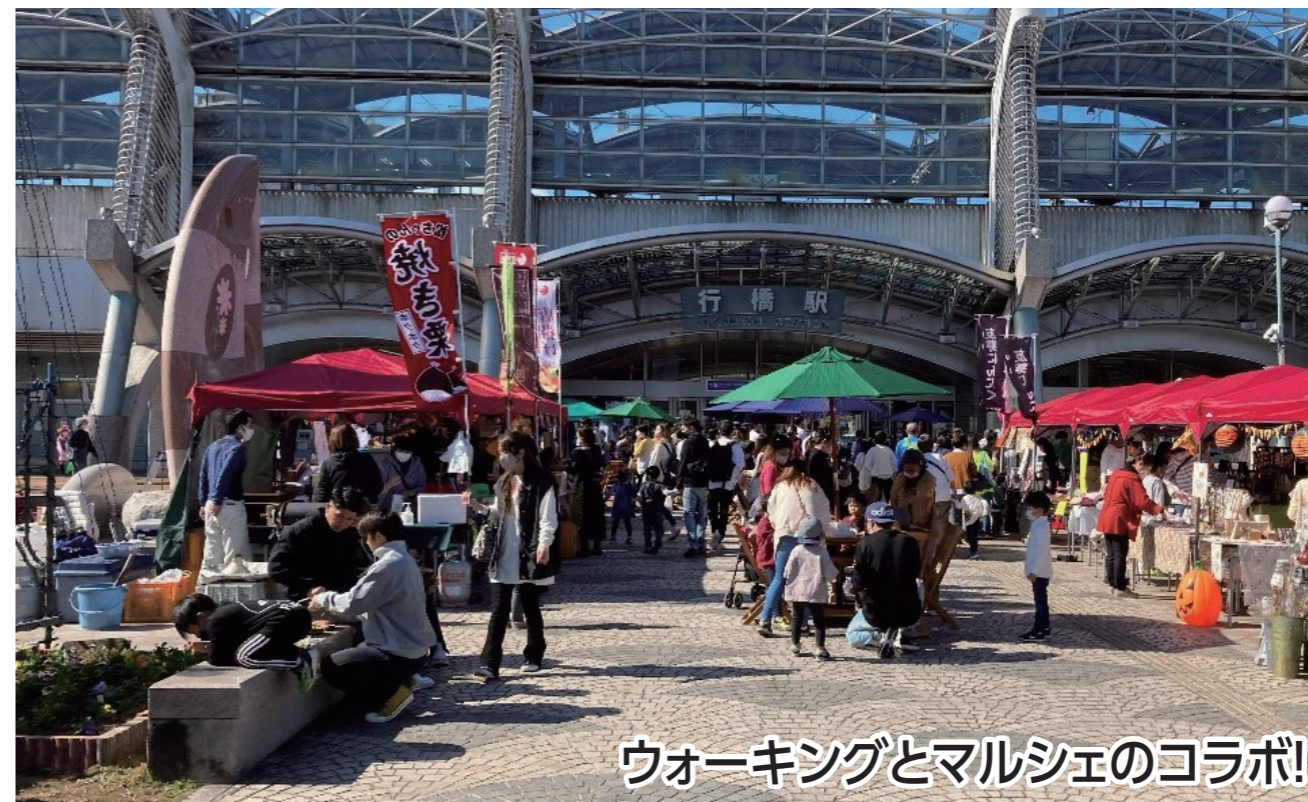
ウォーキングとマルシェのコラボ!

ハロウィンにちなんで、子ども様も仮装してウォークを楽しめる!もちろん大人の仮装も大歓迎!行橋の各自治体とコラボしマルシェ開催。ウォーキング後は、マルシェにて食事などをゆっくり堪能いただける。