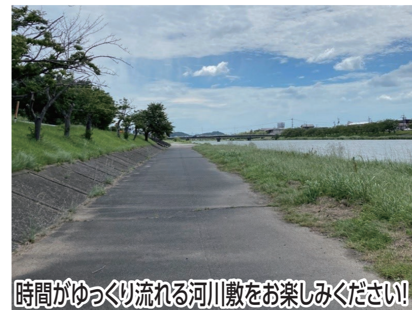
時間がゆっくり流れる河川敷をお楽しみください!