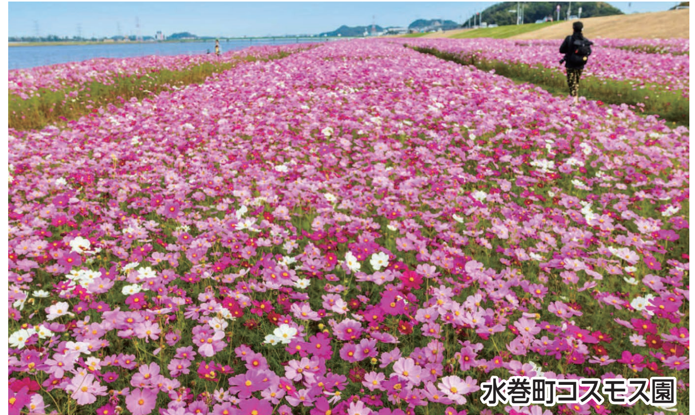
水巻町コスモス園

折尾の秋の風物詩、堀川の「幸せの黄色いハンカチ」や遠賀川河川敷に広がるコスモス園をめぐるコースです。少しずつ涼しくなる風を感じながら歴史や文化、自然に触れて初秋のウォーキングをお楽しみください。