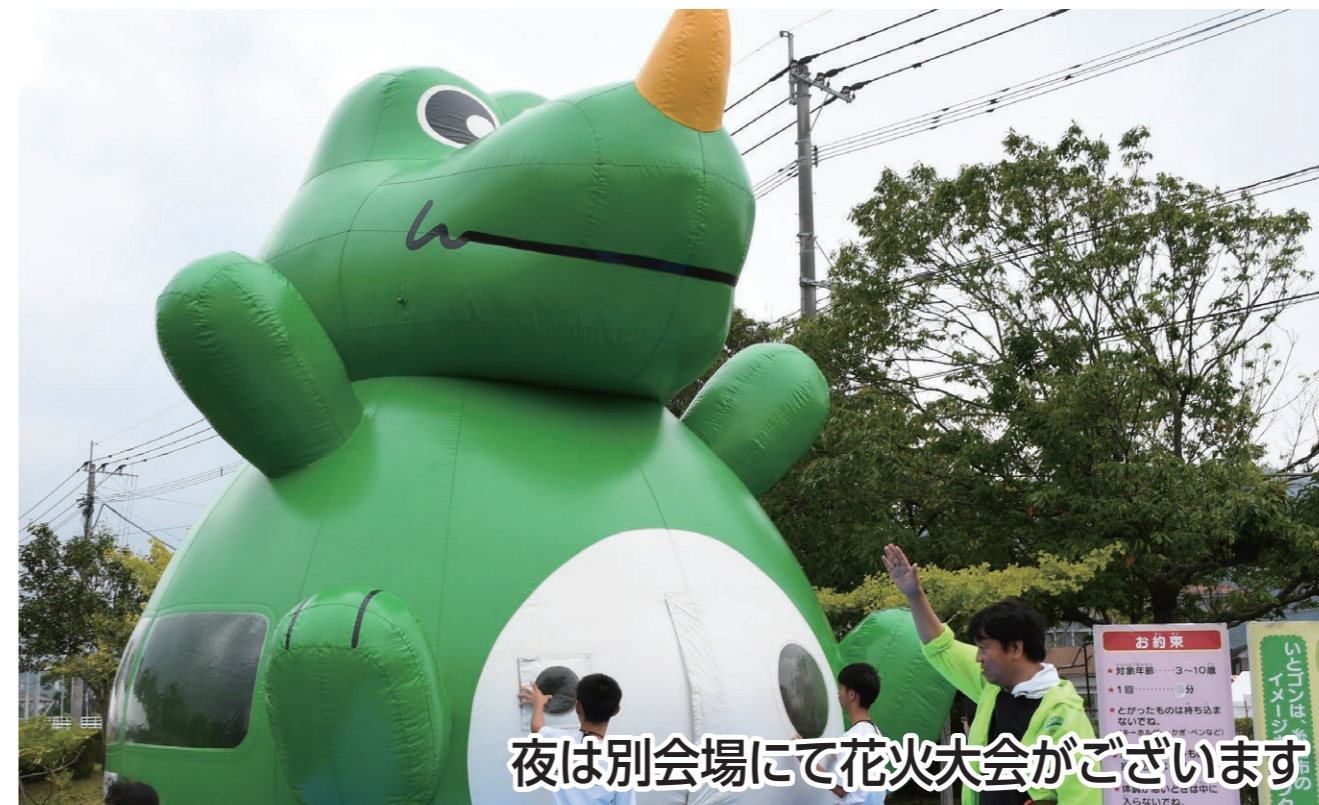
夜は別会場にて花火大会がございます

筑肥線100周年を記念し、「糸島市民まつり」を堪能するウォーキングです。お帰りはシャトルバス(有料)をご利用下さい🚌夜は5年ぶりに花火大会も開催される予定なので、1日中、糸島の魅力に浸って下さい☆