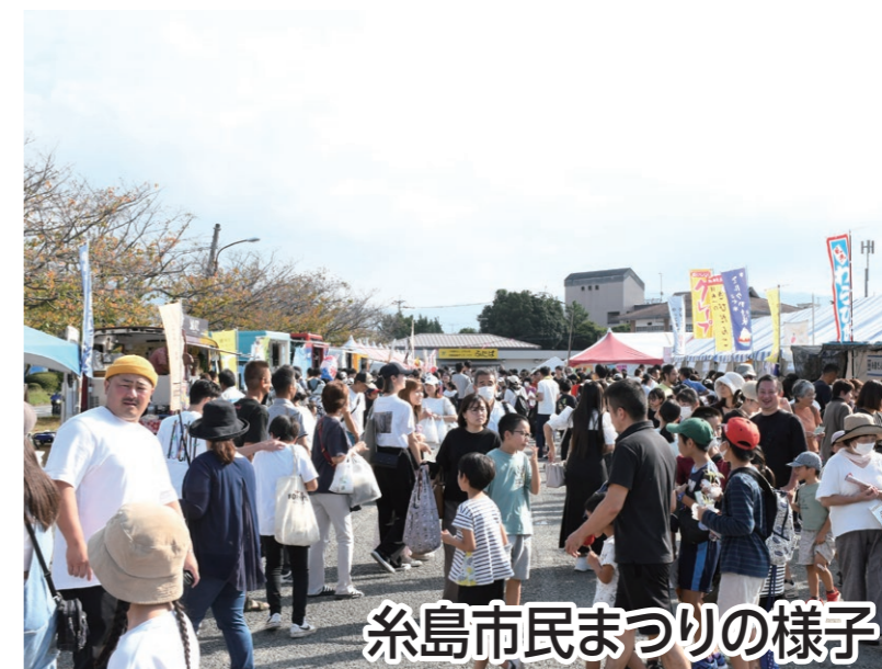
糸島市民まつりの様子