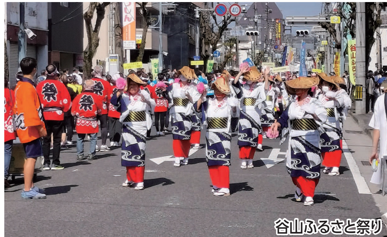
谷山ふるさと祭り

谷山地区の一大イベント「谷山ふるさと祭」。祭りをお楽しみいただくと共に、谷山神社での参拝や見頃を迎えた慈眼寺公園のコスモス畑を巡ります。ゴール後は、にぎわいパートナー”La Plus”施設もお楽しみ。