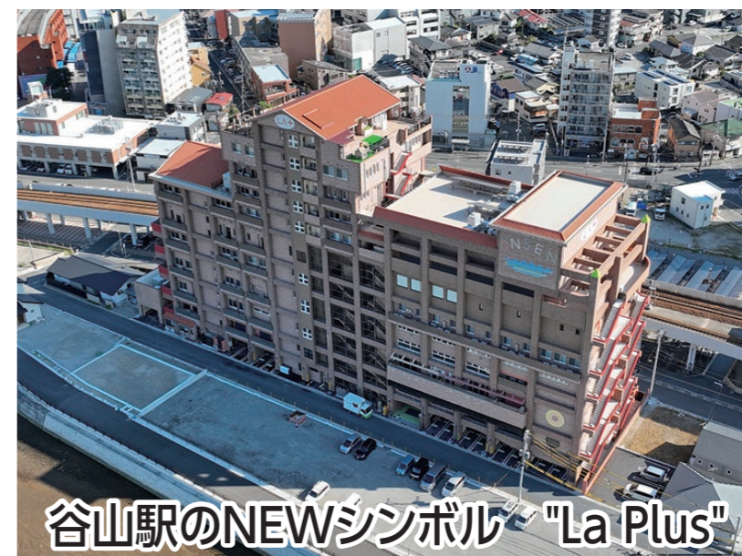
谷山駅のNEWシンボル "La Plus"