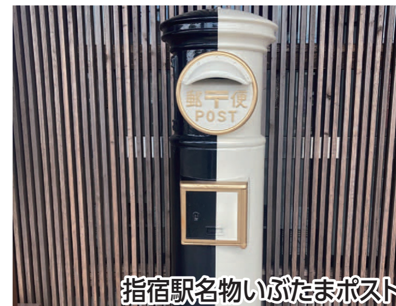
指宿駅名物いぶたまポスト