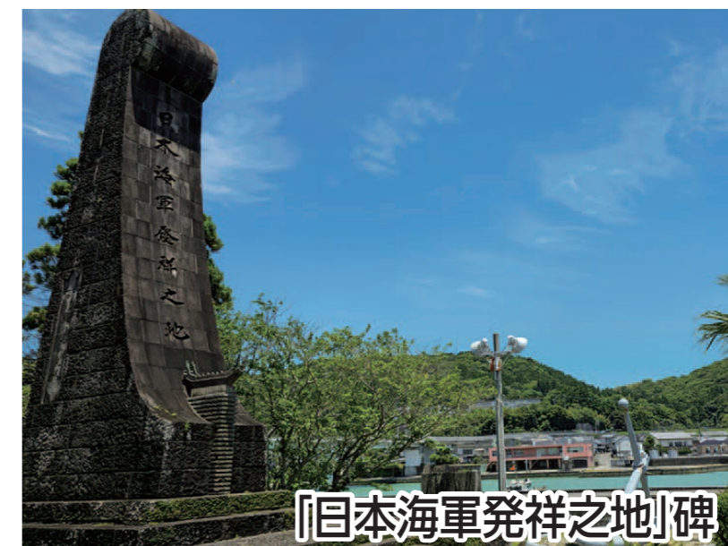
『日本海軍発祥之地』碑