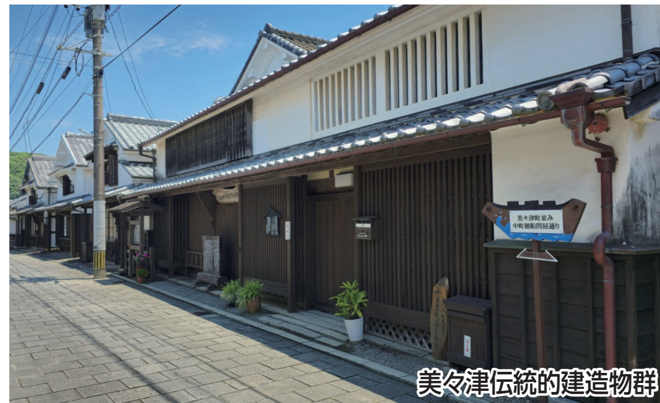
美々津伝統的建造物群

日向灘・美々津海岸の潮風を受け、風光明媚な美々津の町並みを堪能でき、またコース途中には、日本海軍の発祥とされる石碑が建てられており、古き日本を感じられるコースです。