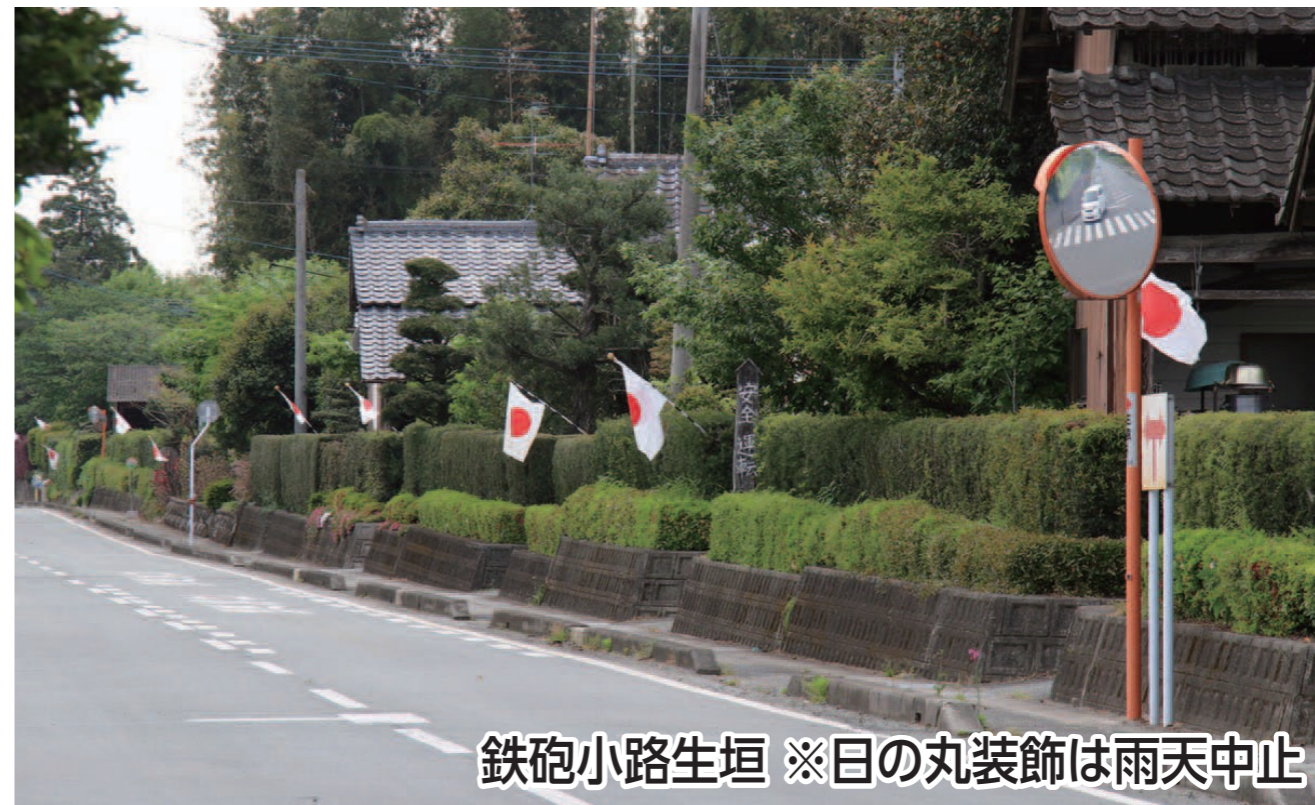
鉄砲小路生垣 ※日の丸装飾は雨天中止

※蘇古鶴神社では鉄砲小路ふるさとふれあい祭りを開催(雨天中止)地元のお店やキッチンカーの出店もあります。(9:00~15:00予定)