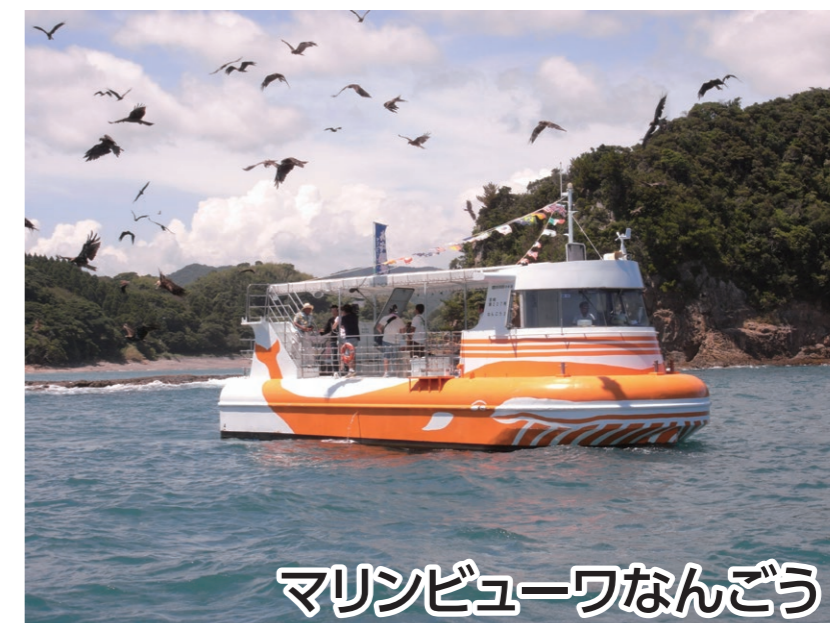
マリンビューワなんどう