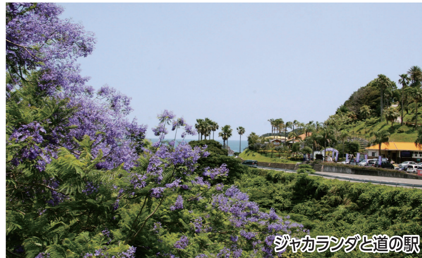
ジャカランダと道の駅

世界三大花木の1つである「ジャカランダ」に囲まれ、潮風を感じながら、太平洋が広がる日南海岸をお楽しみいただけます。