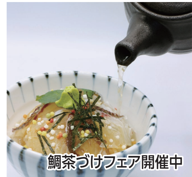
鯛茶づけフェア開催中