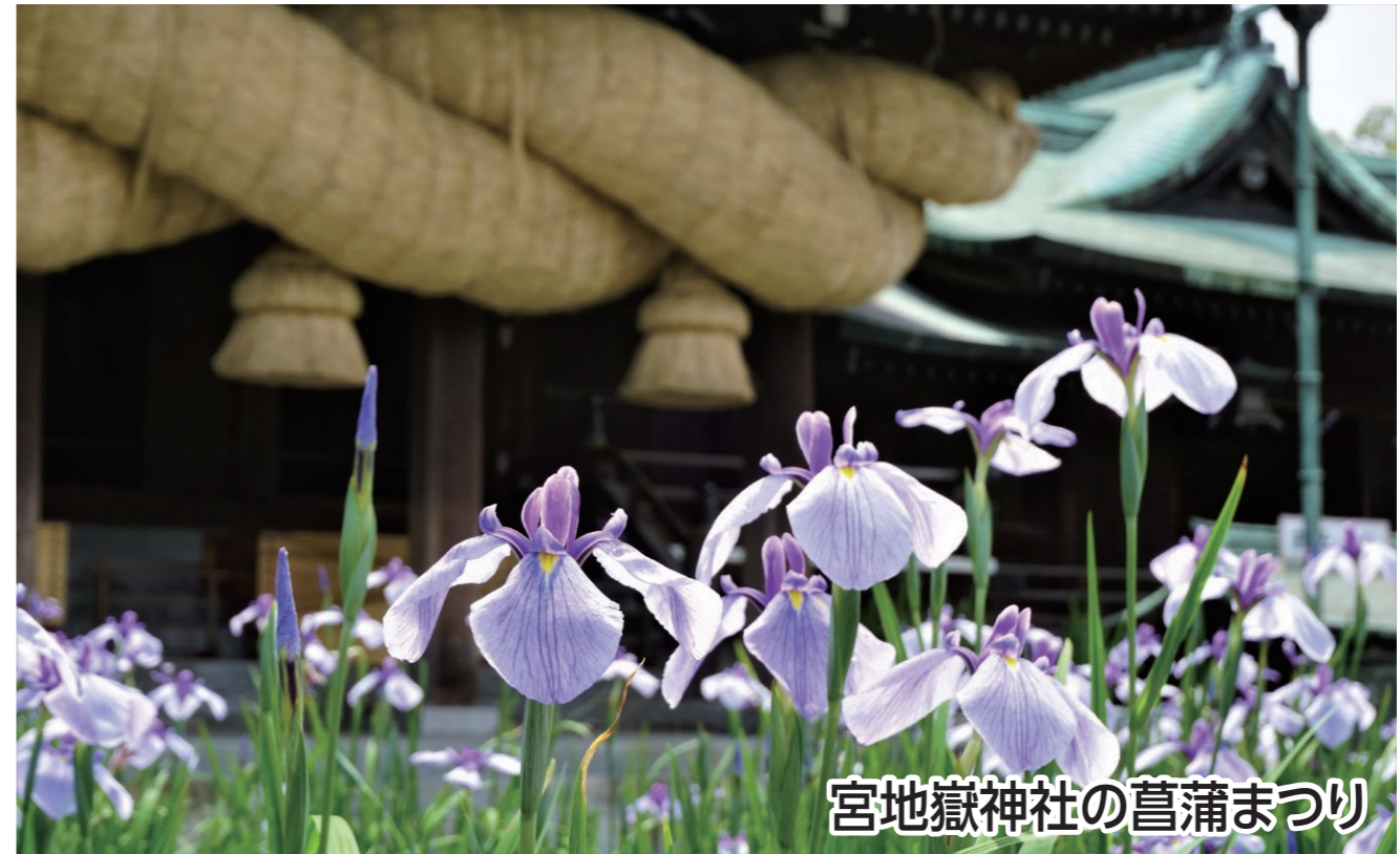
宮地嶽神社の菖蒲まつり

宮地嶽神社の菖蒲まつりと祝・重要文化財豊村酒造と津屋崎千軒めぐり 宮地嶽神社の菖蒲まつりや津屋崎千軒、重要文化財に今年指定された「豊村酒造」を巡ります。当日ランチは、ぜひ期間限定で開催中の「ふくつの鯛茶づけフェア」を楽しんで!