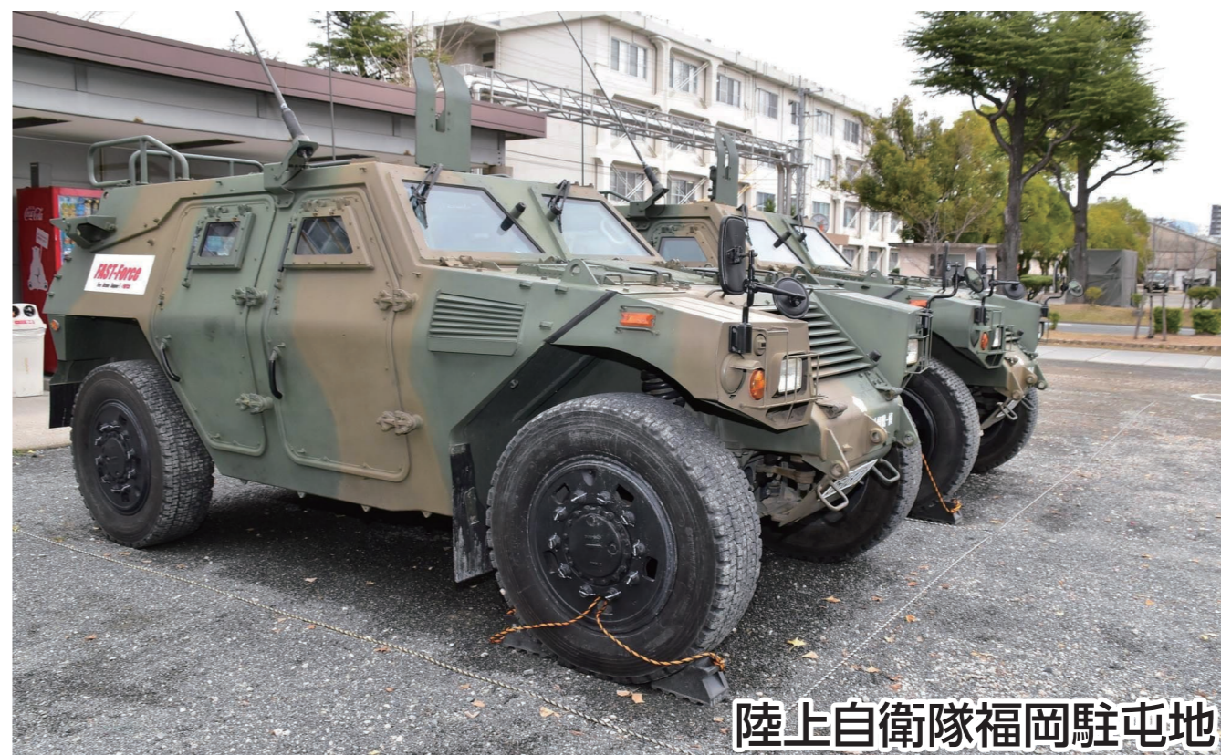
陸上自衛隊福岡駐屯地

古代ロマンを感じる奴国の丘歴史資料館、5年ぶり一般公開の陸上自衛隊 福岡駐屯地記念行事に立ち寄るコースです。コース終盤は、レトロな雰囲気漂う銀天町商店街でお買い物をお楽しみください。