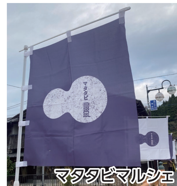
マタタビマルシェ