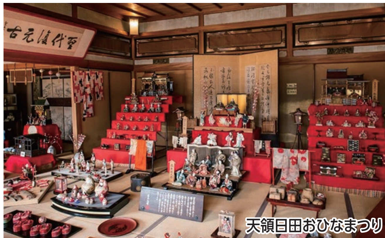
天領日田おひなまつり

天領日田の春の温もりを感じながら 豆田町『ひな祭り』を巡る「日田めぐりウォーク」 日田市では、この時期『天領日田おひなまつり』が開催されており、大変賑わいます。春の暖かさの中で日田の街並みを楽しみつつ、日田駅長おすすめの「福地のうなるホルモン」や「日田焼そば萬天楼極」を是非ご賞味下さい。