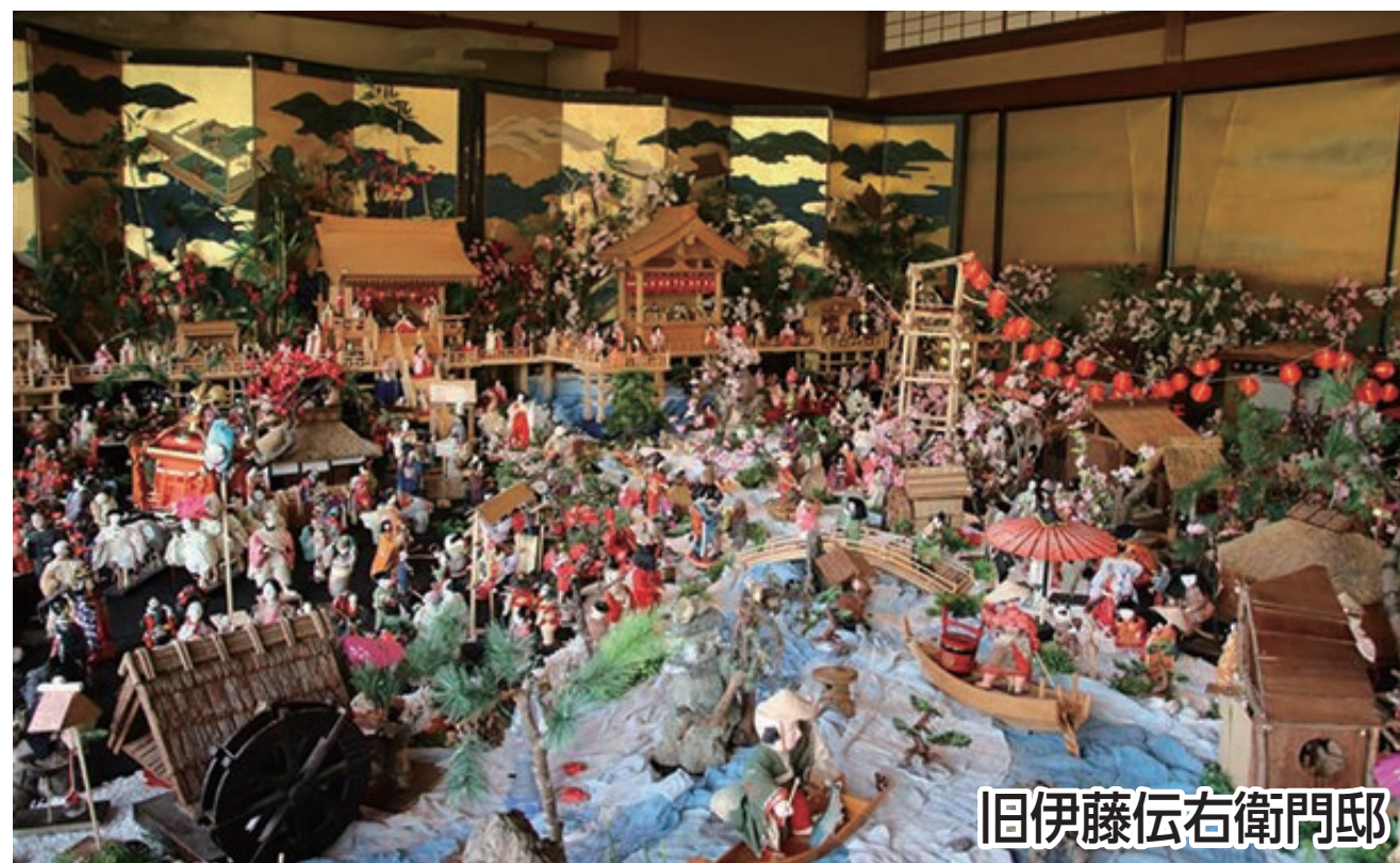
旧伊藤伝右衛門邸

飯塚の春の訪れを告げる雛の祭りでは旧伊藤伝右衛門邸の圧倒的な雛飾りをご鑑賞ください。曩祖八幡宮と皇祖神社では特別御朱印をご準備してお待ちしています。