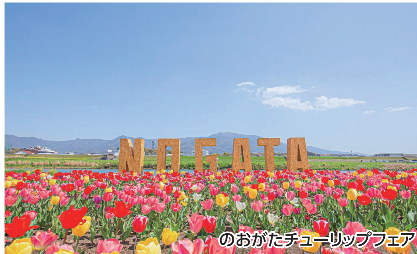
のおがたチューリップフェア

※遠賀川河川敷で同時開催される「パンマルシェ」は10時から開催です。ご注意ください。